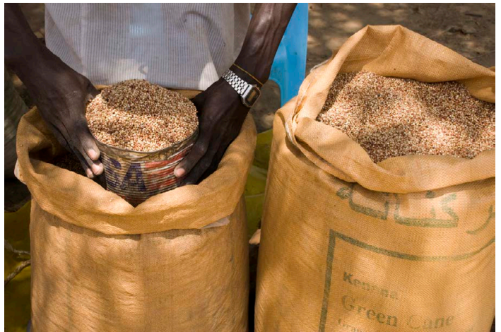
Soudan – Rodrigo Ordonez/Mercy Corps

Il est possible d'organiser une ou plusieurs foires au cours d'un programme. Si les foires sont répétées, Mercy Corps est généralement impliquée dans la mise en place des premières éditions puis confie la gestion des événements suivants à un partenaire, une entreprise ou une communauté locale.