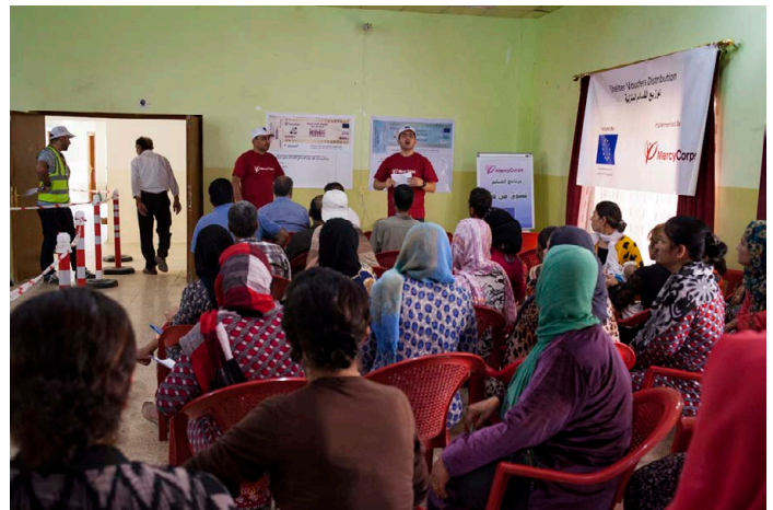
Irak – Rasht Twana pour Mercy Corps

Comme avec les fournisseurs, utilisez les bons fictifs pour aider les participants à comprendre leurs caractéristiques et se familiariser avec le format des bons. Comptabilisez les bons fictifs distribués et veillez à récupérer le même nombre de bons à la fin de la séance. Précisez que les bons ont été soigneusement conçus pour empêcher la fraude, mais n'expliquez pas les éléments de sécurité utilisés.