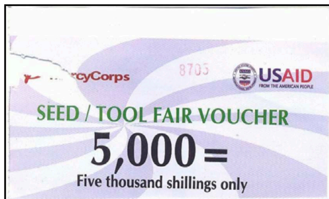
Bons issus d'une foire aux semences, MC Ouganda.