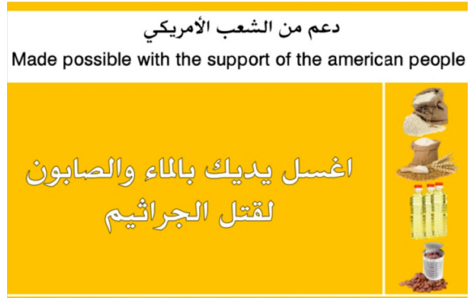
Exemple de bon de marchandises issu du programme TEPF de MC Yémen, financé par l'USAID.